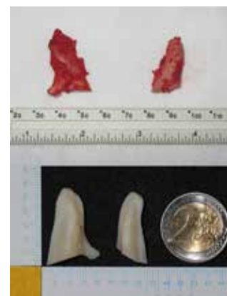
Рис. 25. Резецированные венечные отростки