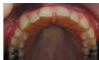
Рис. 4-7. Вид зубных рядов пациентки перед началом лечения