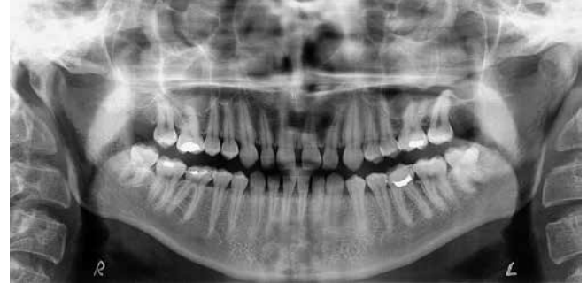
Рис. 15. Ортопантомограмма пациентки