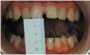
Рис. 8. Степень открывания рта