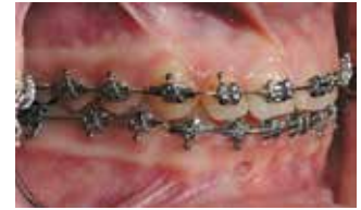
Рис. 9-11. Вид зубных рядов на этапе нивелирования