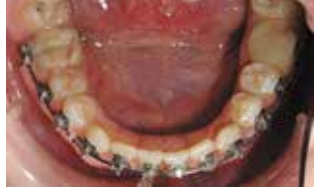
Рис. 12-13. Вид зубных рядов на этапе нивелирования